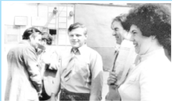
У кормоцеху колгоспу «Добробут».