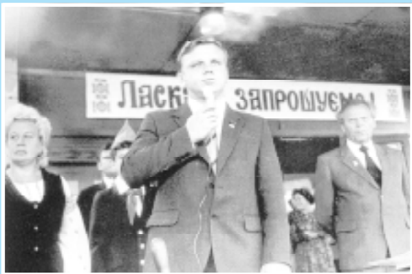
На відкритті нової школи в Городні.