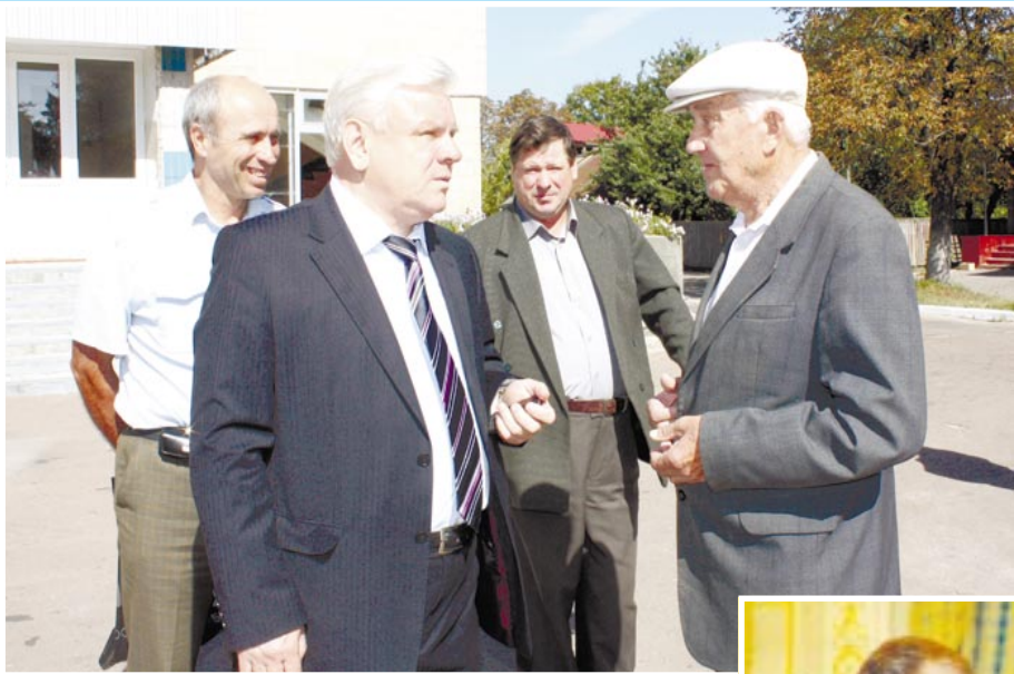
У Городні 12 вересня 2012 року.