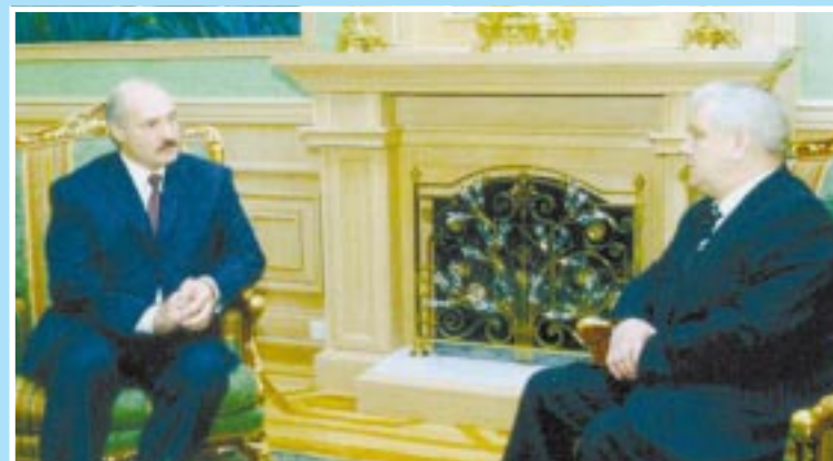
Розмова з президентом Білорусі Олександром Лукашенком.

Кілька фотомиттєвостей із його біографії дадуть змогу нашим читачам, а особливо тим, хто особисто його знає, а заодно й тим, хто тільки знає це прізвище, збагнути ще глибше цю людину – самовіддану в роботі, просту і демократичну у стосунках з людьми і разом з тим офіційно скромну на державних посадах. Він завжди об'єднує людей на добрі справи.