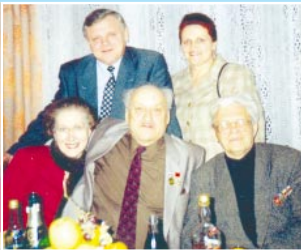
Тепла зустріч родини Шаповалів з російським письменником Петром Проскуриним.