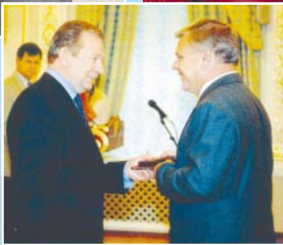
Знак звання «Заслужений економіст» Петру Шаповалу вручає Президент України Л.Д.Кучма.

П.Д.ШАПОВАЛ – людина добре знайома на Чернігівщині. Він пройшов шлях від помічника бригадира тракторної бригади до Надзвичайного і Повноважного посла України. Йому судилося жити і працювати в складний і насичений багатьма подіями час. Він був і є нашим сучасником. Не купував ні посад, ні чинів. Йому довіряли люди, і він завжди виправдовував їх довіря. Для Городні П.Д.Шаповал – то окрема і значима сторінка в історії міста. Він – Почесний громадянин нашого міста.