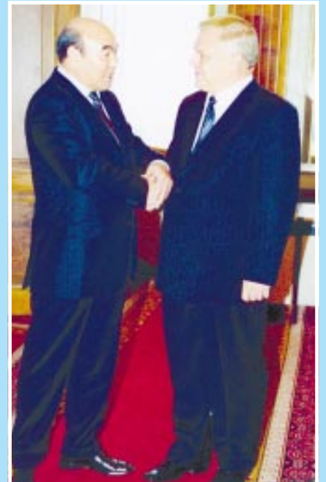
З президентом Киргизії Аскармом Акаєвим.