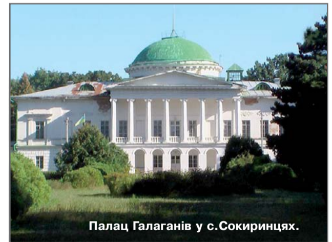
Палац Галаганів у с.Сокиринцях.

Чернігівщина – це один з найцікавіших регіонів сучасної України з величною історією, мальовничою природою та вишуканими архітектурними пам'ятниками державного і світового значення. Та більшість цікавинок цієї землі часто лишаються поза увагою не тільки гостей краю, а й місцевих жителів. Ось ці цікавинки: