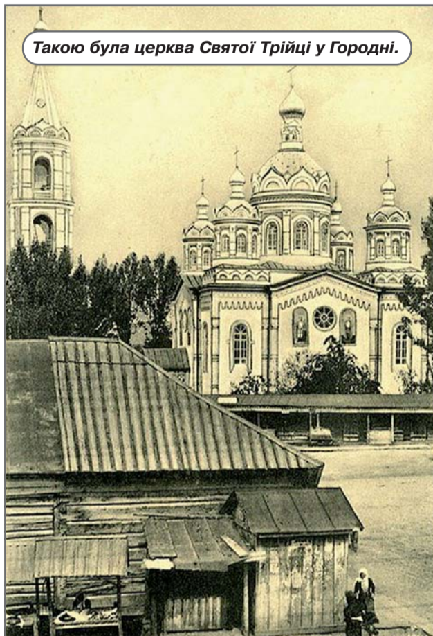
Такою була церква Святої Трійці у Городні.

За даними 1845 року, у Чернігівській губернії було 1892 міст і поселень. Налічувалось 1 мільйон 370 тисяч 160 жителів. Майже половину населення склали селяни, які працювали в поміщицьких господарствах. Вільних землеробів налічувалось всього 230. А от казенних селян